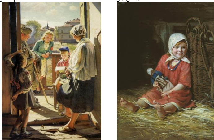
Рис. 4. Примеры оптимистического искусства

Оптимистическое искусство возникает, когда организация душевного мира художника соответствует принципу саморазвития . Для оптимистического искусства характерно воплощение одухотворенной радости и устремленности в светлое будущее.