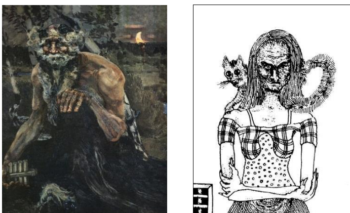
Рис. 5. Примеры регрессивного искусства

Если художник нарушает принцип саморазвития, он служит не эволюционно новым , а эволюционно старым «архаичным» силам.