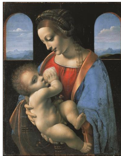
Рис. 6. Примеры гармоничного искусства

Для гармоничного искусства характерно построение гармоничной композиции, которая воплощает собой одухотворенную Идею. Через общение с таким искусством человек, возможно, общается с платоновским миром одухотворенных Идей, со своей «небесной родиной».