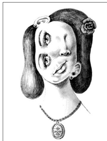
Рис. 7. Примеры дисгармоничного искусства

В тесте «Несуществующее животное» дисгармоничность проявляется как банальное искусственное соединение известных изображений животных (лошади, собаки, свиньи, рыбы) с «готовыми» существующими деталями – «кошка с крыльями, рыба с перьями, собака с лапами и т. п.» [10. С. 66].