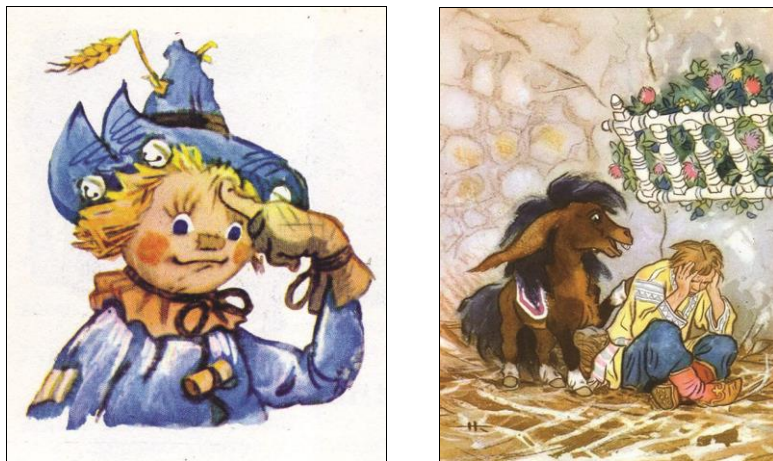
Рис. 2. Примеры лирического искусства

Лирическое искусство возникает, когда организация душевного мира художника соответствует принципу активности . Для лирического искусства характерно одушевлять неодушевленное .