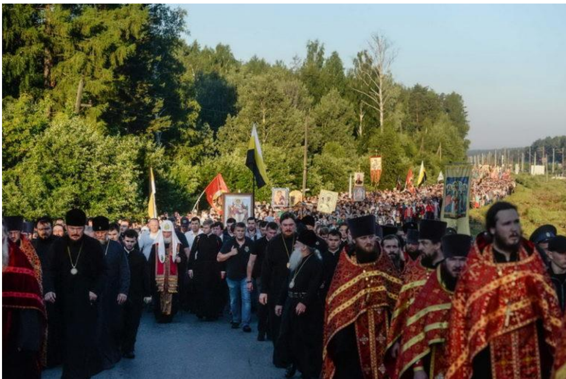
Уже три часа светит утреннее солнце. Позади без малого два десятка километров. Святейший по-прежнему впереди.