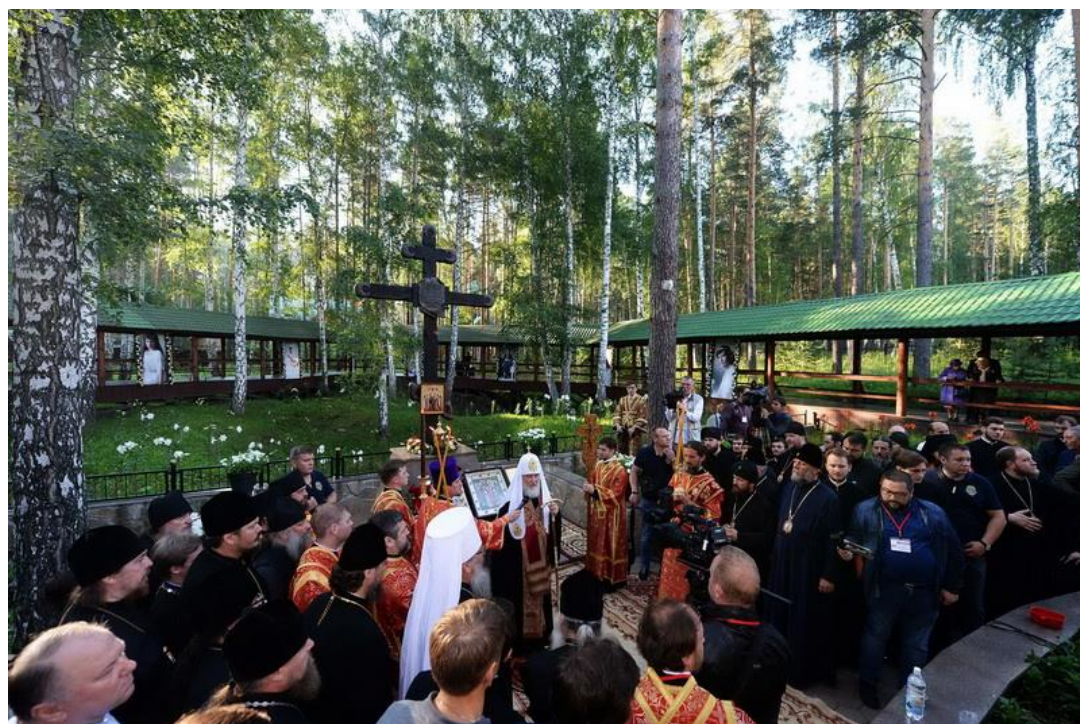
Патриарший молебен у Ганиной Ямы.