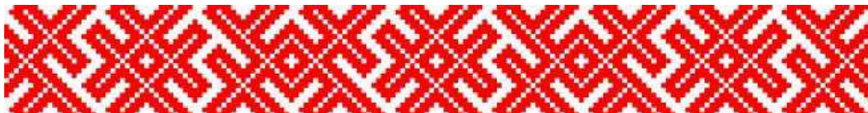
Рис. 1 Линейный узор, образованный ромбами с крестами внутри [Макагонов, 2016: 25].

Основой упомянутого знака является ромб или квадрат, стоящий на одном из углов и, как вариант – разделённый либо на четыре, либо на шесть ромбов. Каждый ромб может быть либо пустым, либо с точкой внутри. В русских вышивках, особенно на русском Севере, он символизирует счастье, душевное спокойствие, плодородие для женщин и носит народное название «орепей» или «арепей» (он же «репейник», «дубок», «колодец») ( http://www.rusorn.ru/значение-символики-узоров-и-орнамент/ ). Ромб с точкой внутри – это символ засеянной земли, то есть – плодородия (Рис. 1):