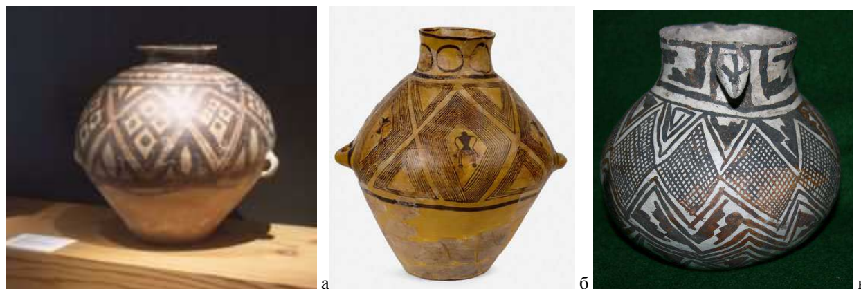
Рис. 4 а) Сосуд культуры Яншао со знаком «засеянное поле» - в большом ромбе четыре маленьких с точками ( http://qagoma.qld.gov.au/collection/collection_displays/asian_collection/chinese_neolithic_earthenwares )

Присутствует знак «засеянное поле» и на неолитической керамике Яншао (Китай) (Рис. 4а), и на индейской керамике культуры Анасази (Рис. 4в). Во многих случаях это просто ромб, разделённый на четыре маленьких ромба с точками (либо с сеточкой). Тем не менее, можно встретить и композицию, в которой присутствует фигура человека, такую, как и на сосудах из Кукутени (Рис. 4б). На сосудах индейской керамики культуры Анасази ромбы вместо точек заполнены знаком «сеточка», что также является разделением большого ромба на маленькие (Рис. 4в):