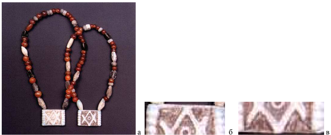
Рис. 9. А) Ожерелья с амулетом (пластина с выгравированным ромбом с точкой – знаком плодородия), Микены, Греция http://www.hartzler.org/cc307/mycenaean/ б)-в) увеличенные фрагменты амулета, с изображениями знаков W и M – символов Великой Богини.

Но какова всё-таки символика самого ромба, который изображался и пустым и заполненным? И вновь гравированная галька из Петра-ту-Ромио помогает найти ответ. Ромб на ней сформирован линиями, которые продолжаютя после пересечения друг с другом. Значит, геометрические фигуры, которые его создают, также являются знаками, самодостаточными геометрическими фигурами. И эти самодостаточные геометрические фигуры – это два пересекающихся знака \Lambda и V (наложенные на плоскости друг на друга). Знак \Lambda – лингам, символ Великого Бога, знак V – женский символ, символ Великой Богини [Миронова, 2014]. Если при пересечении этих знаков (символическом акте оплодотворения) в образующемся ромбе нарисована точка – это символ зародившейся новой жизни. Таково наше объяснение символики знака «засеянное поле». Зарождение новой жизни – оленёнок внутри оленихи на гальке из Петра-ту-Ромио – это подтверждение такой трактовки данного знака.