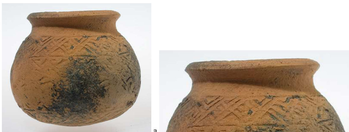
Рис. 2 Небольшой круглодонный глиняный сосуд культуры Бан-Чианг, датируемый приблизительно 500 г. до н.э. ( https://www.robbynuntin.com/Ban-Chiang-Vessel-p/14174.htm ).

Такой же знак присутствует на неолитической крашеной керамике из Бан-Чианга (Таиланд), в археологической культуре, обнаруженной в 1966 г. американским студентом-антропологом Стивеном Янгом (Рис. 2а-б). Специалисты из Университета Музея Пенсильвании в настоящее время вывозят с археологического сайта в Бан-Чианге огромное количество найденных артефактов в США для изучения данной культуры за пределами Таиланда, в лабораториях этого университета, а также в рамках проекта The Ban Chiang Project, в Институте Южно-Азиатской Археологии (Institute for Southeast Asian Archaeology – ISEAA) ( https://iseaarchaeology.org/ban-chiang-project/excavation-finds/ ). Уже обнаружены тонны артефактов (керамика, металлические изделия, почва, уголь, кости животных, скелеты обитателей древнего поселения), однако, несмотря на многолетние исследования, на сайте данного института нет ни одной опубликованной научной работы в открытом доступе. Тем не менее, кое-что всё-таки можно увидеть и в нескольких стендах небольшого музея г. Бан-Чианг, а также на сайтах аукционеров, которые каким-то образом получают доступ к уникальным артефактам для их последующей продажи.