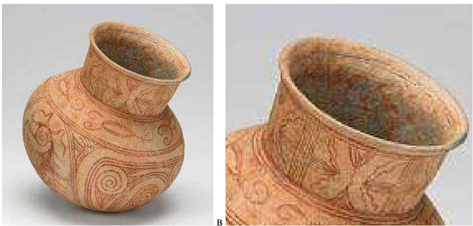
Рис. 3 а) Кувшин из Бан-Чианга (Таиланд); б) увеличенный фрагмент со стилизованным орнаментом «засеянное поле» (ромбы и косые кресты) 100 до н.э. -100 н.э. http://www.archivedauctions.com/s/250299/thai-neolithic-ban-chiang-pot/

Данная манера росписи характерна для позднего этапа культуры Бан-Чианг и сильно отличается от трипольско-кукутенской, однако все базовые символы, помимо каймы из знаков «засеянное поле», сохранены, а именно: спирали (хвост тарантула на узкой кайме под горлом кувшина и в центральной части сосуда, сердцевидное изображение, расположенное вдоль узкой каймы под горлышком кувшина, которое символизирует Великую Богиню).