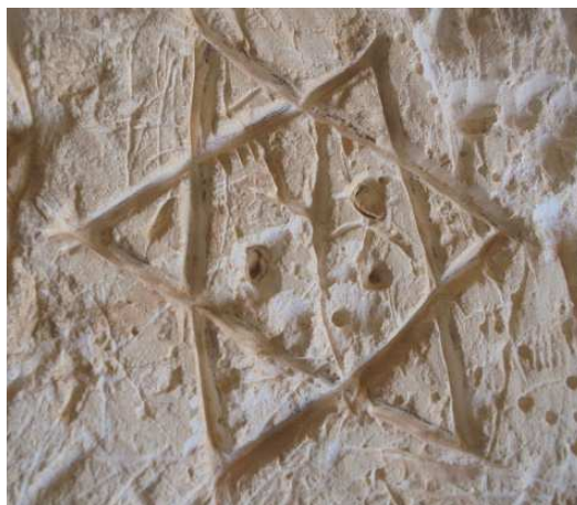
Рис. 10 Изображение шестиконечной звезды на стене пещеры Эль-Абьяд (р-н Пальмиры, Сирия) [Валецкий, Миронова, 2017].

В исследовании ещё одного знака из пещеры Эль-Абьяд, а именно, шестиконечной звезды (Рис. 10), О.В. Валецкий приходит к выводу о том, что обнаружение на стенах пещерного храмового комплекса, которым является пещера Эль-Абьяд, символов Великой Богини вместе с символом «шестиконечная звезда» [Валецкий, 2018] является немаловажной деталью, показывающей трансформацию символов Великой Богини и её культа в культ Инанны, который известен у шумеров.