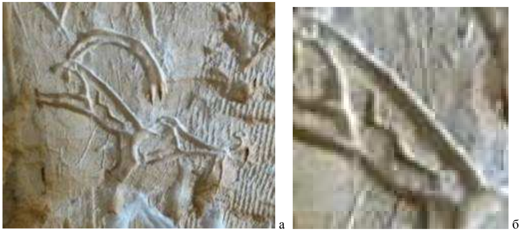
Рис. 8 Рисунок из пещеры Эль Абьяд - изображение самки горного барана со знаком W на боку. Петроглиф из пещеры Эль-Абьяд, Сирия; б) увеличенный фрагмент туловища самки горного барана со знаком W [Валецкий, Миронова, 2017].

Но какова всё-таки символика самого ромба, который изображался и пустым и заполненным? И вновь гравированная галька из Петра-ту-Ромио помогает найти ответ. Ромб на ней сформирован линиями, которые продолжаютя после пересечения друг с другом. Значит, геометрические фигуры, которые его создают, также являются знаками, самодостаточными геометрическими фигурами. И эти самодостаточные геометрические фигуры – это два пересекающихся знака \Lambda и V (наложенные на плоскости друг на друга). Знак \Lambda – лингам, символ Великого Бога, знак V – женский символ, символ Великой Богини [Миронова, 2014]. Если при пересечении этих знаков (символическом акте оплодотворения) в образующемся ромбе нарисована точка – это символ зародившейся новой жизни. Таково наше объяснение символики знака «засеянное поле». Зарождение новой жизни – оленёнок внутри оленихи на гальке из Петра-ту-Ромио – это подтверждение такой трактовки данного знака.