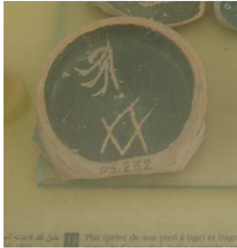
Рис. 6 Фрагмент сосуда (донце) из Музея Карфагена с ромбом и косыми крестами.

Итак, перед нами геометрическая фигура с ромбом в центральной части. Почему так важен был именно ромб? Какова его символика? На эти вопросы удалось ответить при внимательном рассмотрении гравированной гальки из Петра-ту-Ромио (Кипр). Прежде всего, нужно отметить ромбовидную форму самой гальки. На ней изображены олениха с оленёнком и в центре композиции – ромб. Часть туловища оленихи вписана в ромб. В ромбе находятся буквы РОД, об этом мы уже писали подробно в предыдущем исследовании [Миронова, 2012]. И прорезанные каким-то острым тонким инструментом буквы и силуэты животных на данной гальке сопровождаются очень тонкими тёмными штрихами и точками. И при внимательном рассмотрении всех компонентов, образующих букву Д в слове РОД, мы обнаружили, что она формируется изображением ещё одного, чрезвычайно маленького оленёнка, нанесённого этими микроскопически маленькими тёмными штрихами и точками. Силуэт оленёнка выполнен тёмным цветом, а сам он остаётся светлым (Рис. 7):