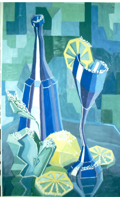
5. Замёрзшие предметы.