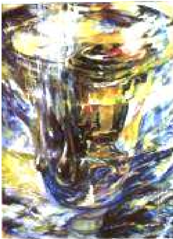
Космический самовар. 1995 г. Холст. Масло. Франтенко Т.А.