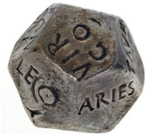
Додекаэдр со знаками зодиака

Соотнесение граней додекаэдра со знаками зодиака было, как минимум, в раннем Средневековье. На территории Женева был найден литой свинцовый додекаэдр, размером примерно в 3 см, покрытый пластинками из серебра с названиями знаков зодиака (см. рис.). Если его ставить в один ряд с «римскими» додекаэдрами, найденными на территории Франции и Англии, то они датируются III – IV веками н.э. Трудно сказать стояло ли за этим соотнесением какое-либо философское представление, или мы имеем только результат удачного переноса знаков зодиака на гадательный предмет. В первом случае, мы имели бы факт связывания в далеком прошлом деления временного цикла на 12 равных частей с последовательной активизацией одной из граней некоторого мистического додекаэдра. Отметим, что некоторые современные исследования, позволяют предположить возможность существования такой связи. 9